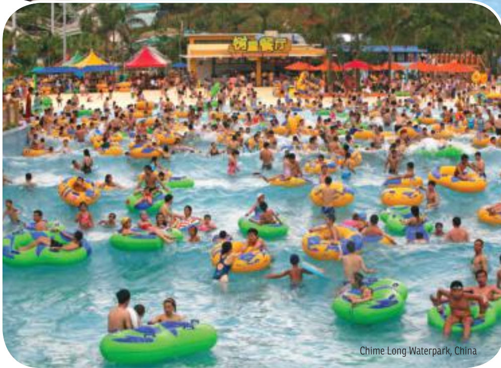
Chime Long Waterpark, China