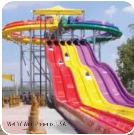
Wet 'n' Wild Phoenix, USA