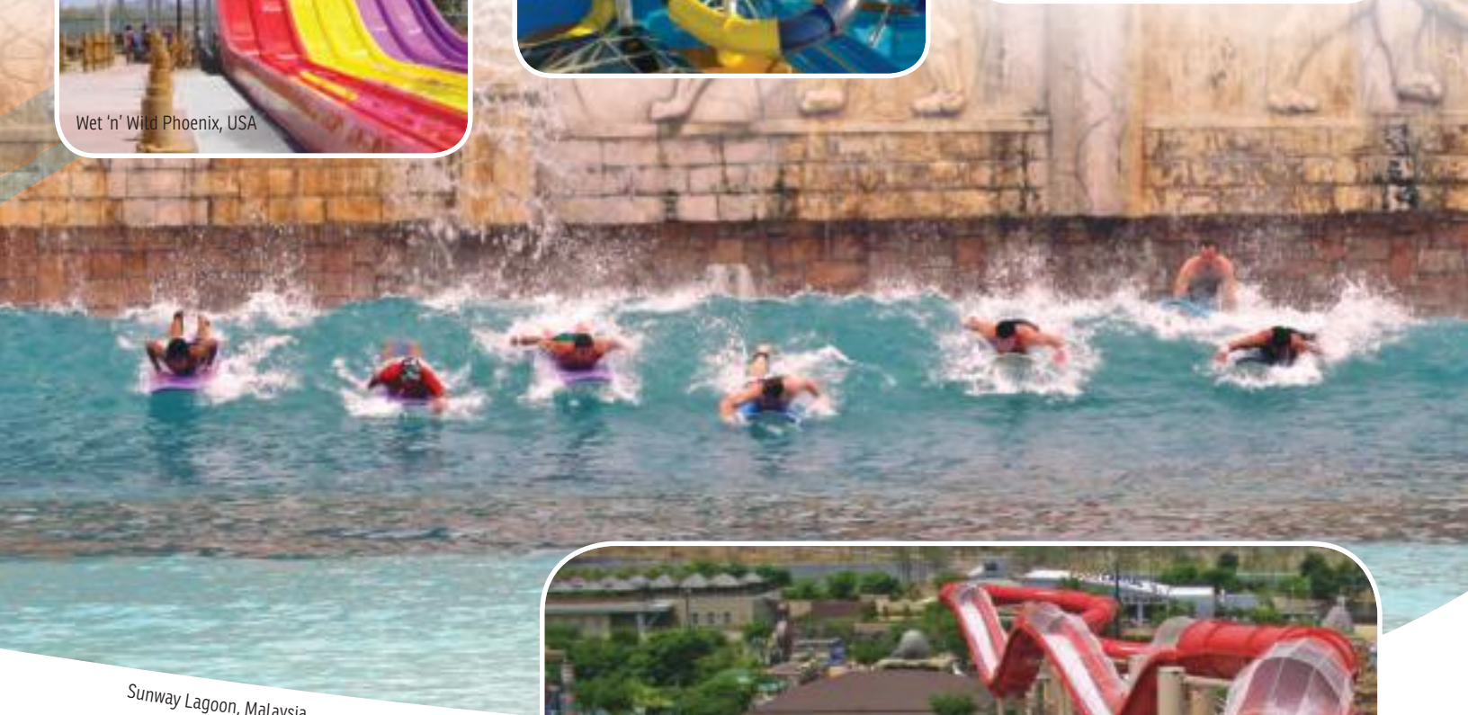
Sunway Lagoon, Malaysia

Команда экспертов обеспечит идеальную смесь аттракционов, чтобы захватить дух детей всех возрастов.