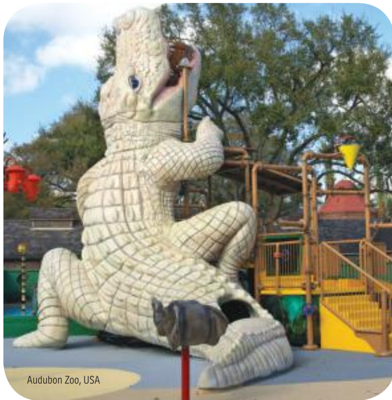
Audubon Zoo, USA

WhiteWater является крупнейшим в мире производителем водных аттракционов, владея 16 700 кв.м. предприятий по производству.