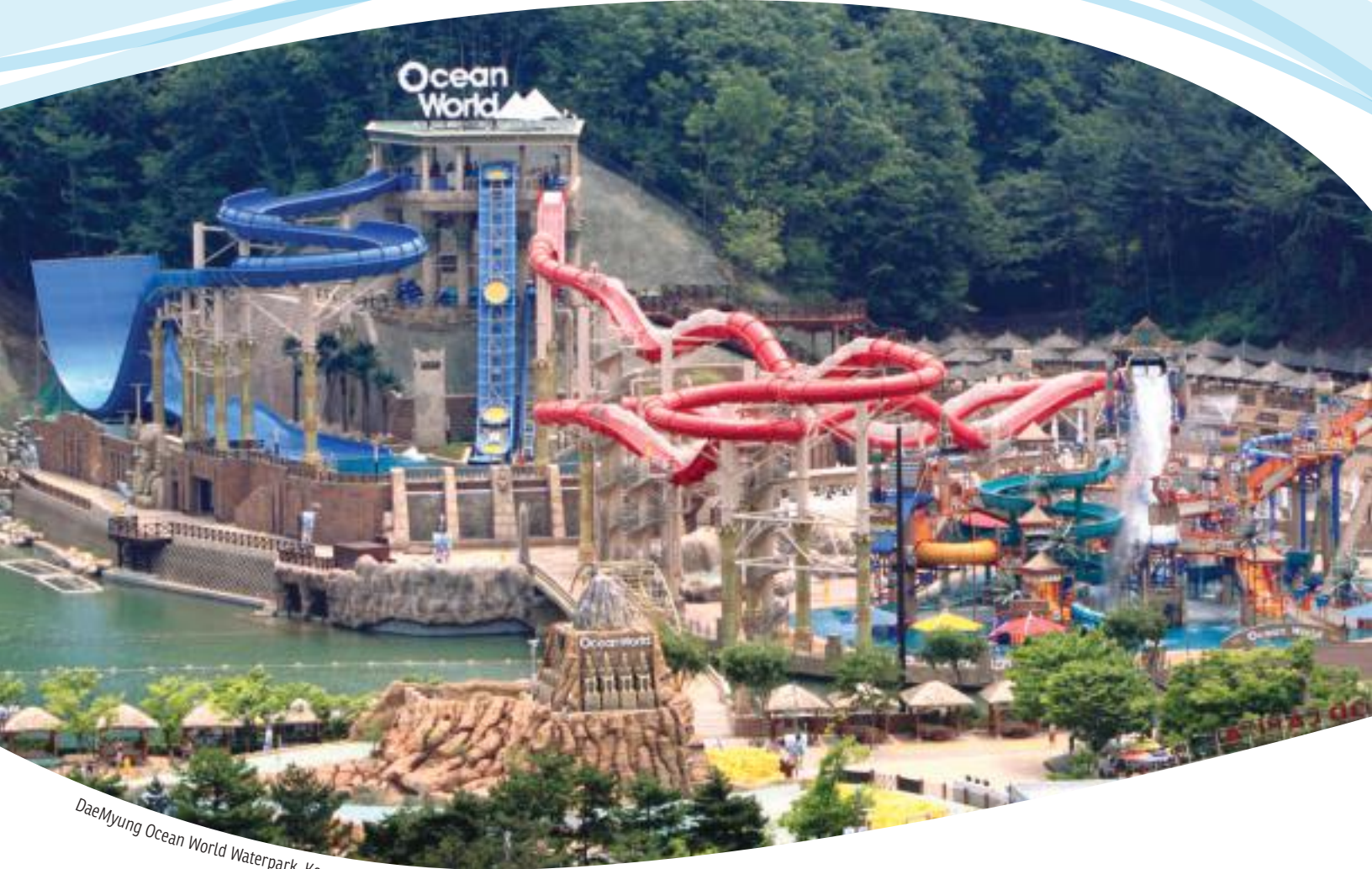
DaeMyung Ocean World Waterpark, Korea

Специализируясь в водных горках, многоуровневых игровых конструкциях AquaPlay™, волновых бассейнах, установках для серфинга FlowRider® и семейных парках развлечения Prime Play™, наша продукция находится в лучших открытых и закрытых аквапарках, гостиницах и курортах, парках развлечения, круизных кораблях и муниципальных водных учреждениях по всему миру.