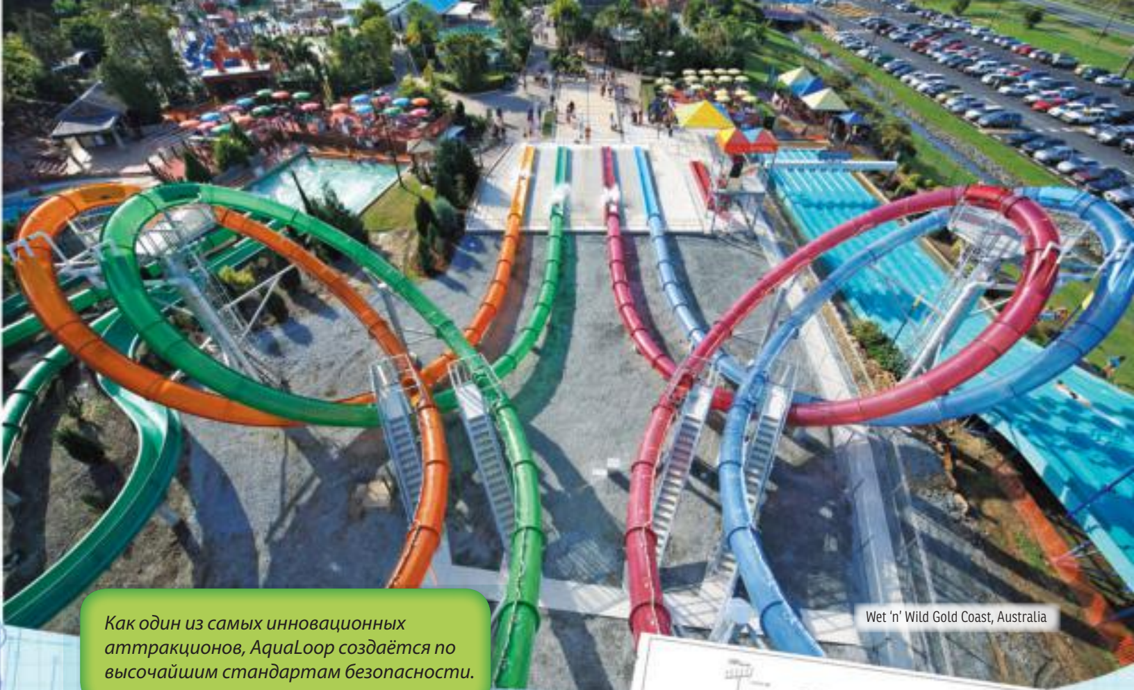
Wet 'n' Wild Gold Coast, Australia

Как один из самых инновационных аттракционов, AquaLoop создаётся по высочайшим стандартам безопасности.