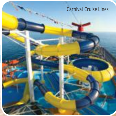
Carnival Cruise Lines