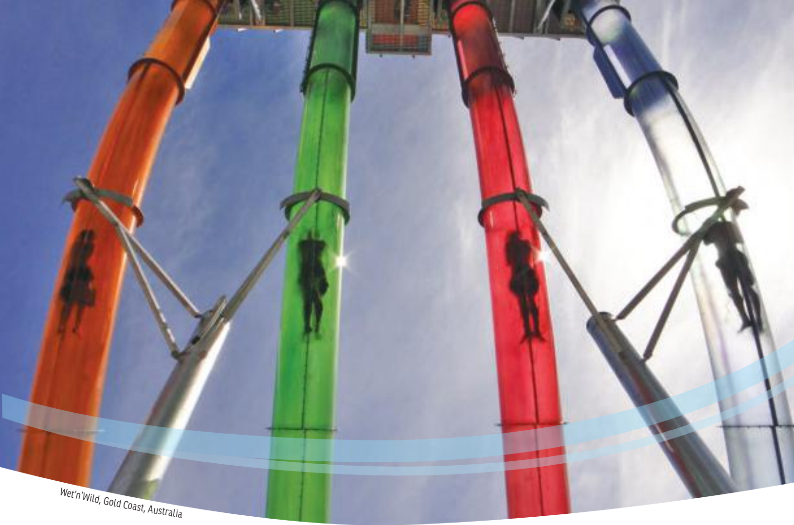
Wet'n'Wild, Gold Coast, Australia