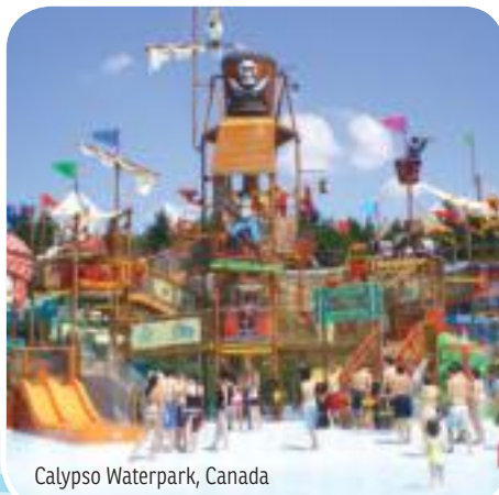
Calyso Waterpark, Canada