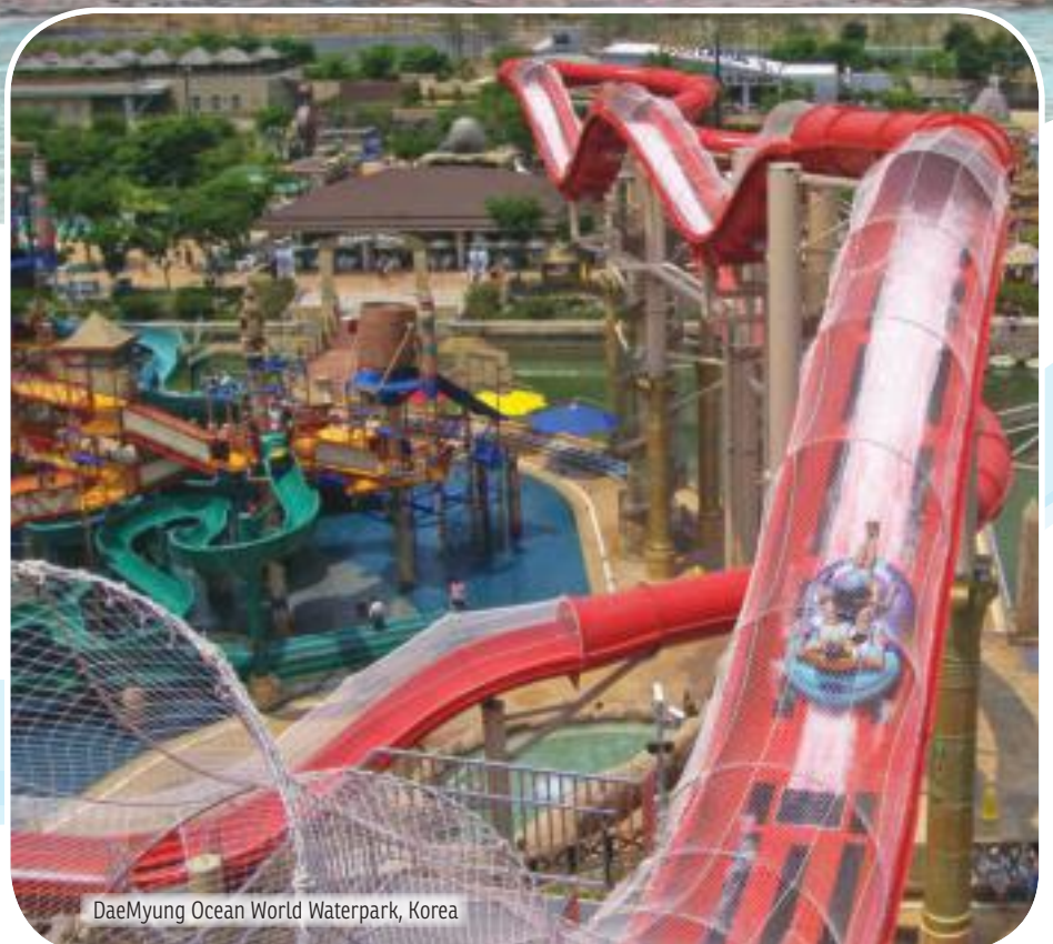
DaeMyung Ocean World Waterpark, Korea

Команда экспертов обеспечит идеальную смесь аттракционов, чтобы захватить дух детей всех возрастов.